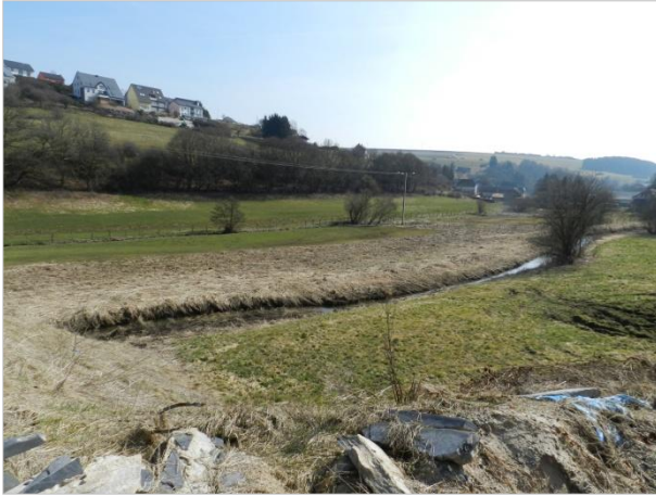
Blickbeziehung 1 – Richtung Osten