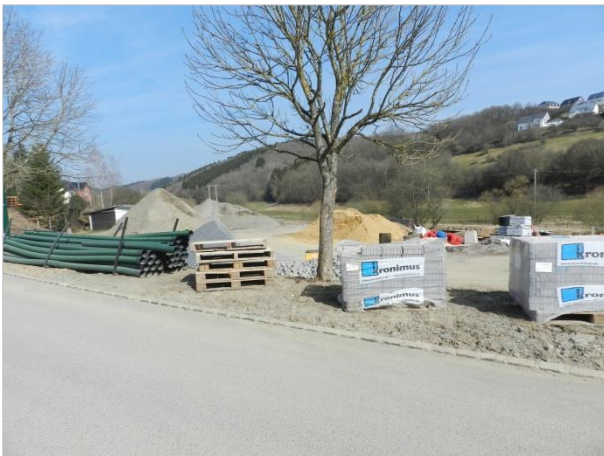
Blickbeziehung 5 – Richtung Nord-Osten