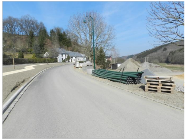
Blickbeziehung 4 – Richtung Norden