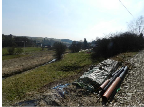
Blickbeziehung 2 – Richtung Süd-Osten