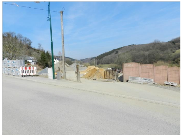
Blickbeziehung 6 – Richtung Norden