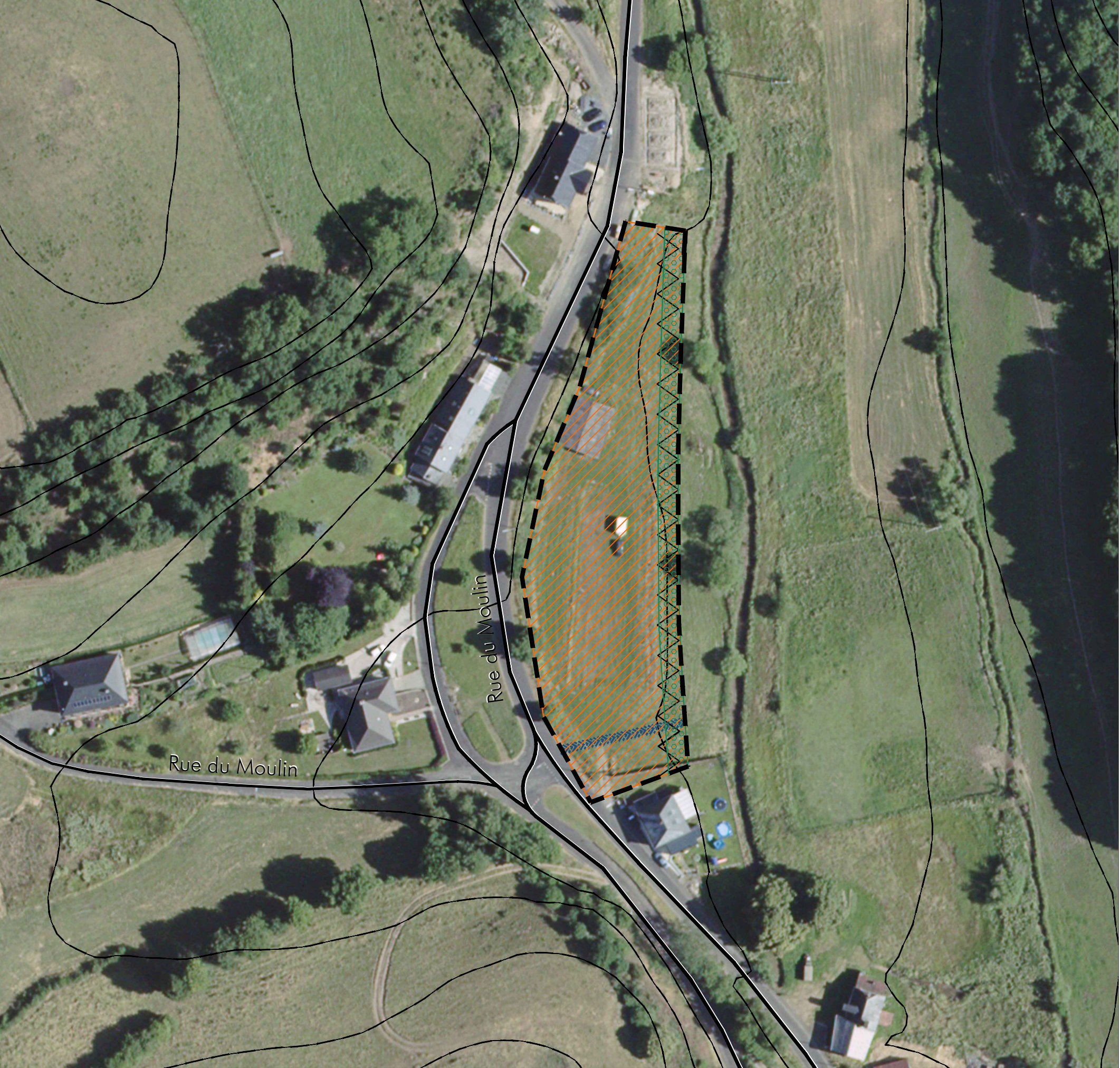
Schéma Directeur Su6 - Rue du Moulin