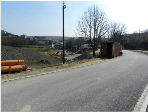
Blickbeziehung 3 – Richtung Süden